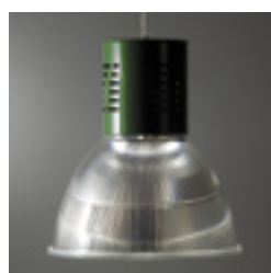
Var 30 P + réfl. int. réf. 433900